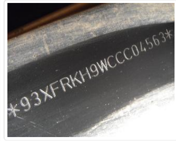
Chassi PAJERO DAKAR FLEX 2012