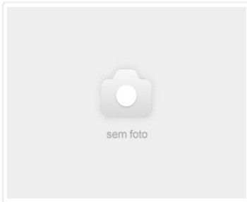
Caixa de Câmbio PAJERO DAKAR FLEX 2010