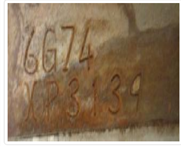
Nº Motor PAJERO DAKAR FLEX 2012