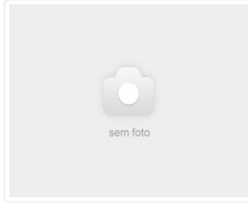
Chassi PAJERO DAKAR FLEX 2011