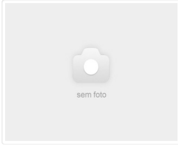
Chassi PAJERO DAKAR FLEX 2010