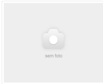
Caixa de Câmbio PAJERO DAKAR FLEX 2011